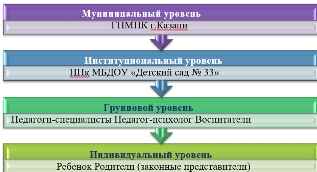
Схема взаимодействия по вертикали